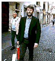
Il ministro Franceschini in Ghetto